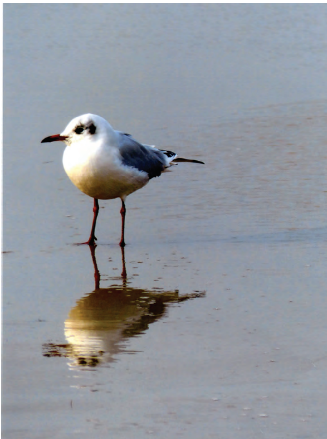
1er Prix : De l'autre côté du miroir de Nicole BRASSEUR