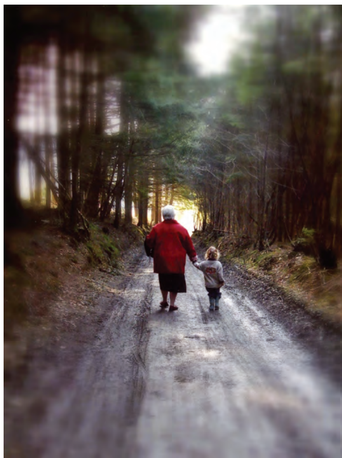
3e. Prix : Sous-bois à Vielsam de Jacques DELFOSSE